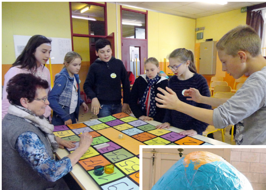
Quelques temps forts vécus au caté

cryptés à l'appui d'images dévoilent l'Esprit Saint en action. Puis vient un temps d'écoute d'un témoin de la foi d'aujourd'hui: les enfants lisent en alternance une bande dessinée sur Marguerite Bourgeoys, qui a construit une école pour les pauvres au Canada. Après un travail de découpage et de collage d'une colombe par chaque enfant, la séance s'achève par une prière partagée à la chapelle Saint-Michel.