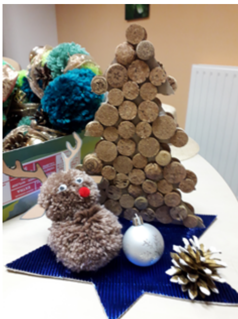
Dans les deux Ehpad, les résidents confectionnent de belles décorations

Noël est aussi l'occasion d'une ouverture vers l'extérieur : accueil des enfants du caté et de la micro-crèche (atelier cuisine, bricolage, chants...). Ainsi, les relations intergénérationnelles sont à l'honneur pendant cette période festive. Les résidents se déplacent aussi en participant au goûter de