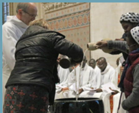
Image symbolique forte de ce jumelage : le mélange des eaux de la source de Cléray et du fleuve Congo.

Plusieurs centaines de personnes venues des quatre coins de l'Orne ont vécu ce 20 octobre 2019 à Sées la signature de la charte de jumelage. Les deux évêques de Mbuji mayi et de Sées, ont paraphé le document officiel au cours d'une célébration simple et émouvante, ponctuée de gestes symboliques : une bénédiction de l'assemblée par les deux évêques avec de l'eau provenant d'une part de la source de Cléray, lieu de fondation du diocèse de Sées, de l'autre du fleuve Congo, si important dans l'économie de la RDC ; Mgr Habert et Mgr Kasanda, à genoux au pied de la statue de Notre-Dame de Sées, pour lui confier l'avenir des deux diocèses ; offrande par le diocèse de Mbuji mayi de deux boutures d'arbres à palabres qui seront plantées au printemps sur le terrain de la Maison diocésaine ; remise à tous les participants de petits sacs de graines de