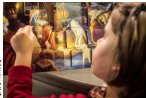
Corinne Meireier / CIRIC

Noël, c'est aussi l'échange de cadeaux, choisis pour leur valeur symbolique, hors de toute idée mercantile: cadeaux-surprise, cadeaux personnalisés, cadeaux maison, privilégiant le commerce équitable. Les objets artistiques sont également très appréciés, tant par ceux qui offrent que par ceux qui reçoivent. C'est la fête de ceux qui imaginent, créent, inventent mille attentions pour les autres, sans oublier ceux qui sont seuls ou dans le besoin.