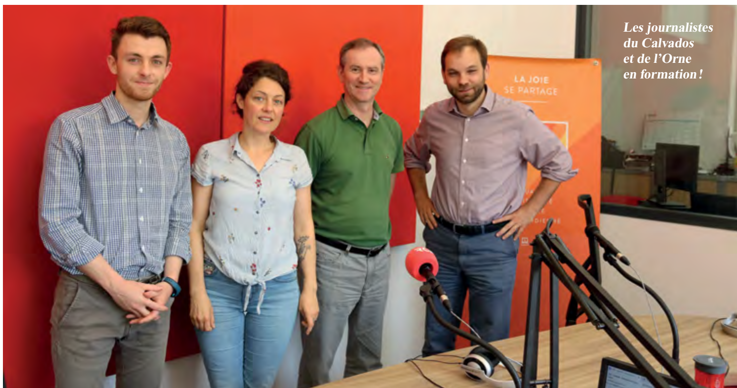
Les journalistes du Calvados et de l'Orne en formation !