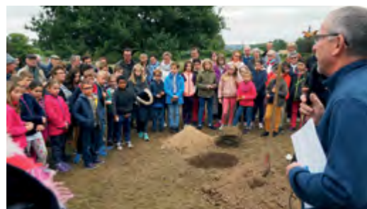
Lors de la Fête de la Création en 2019.

En 2020, le thème sera " la musique, les sons, le silence... ". La musique n'est pas qu'instrument ou voix, et même si des musiciens seront bien sûr présents, on peut aussi l'écouter dans les sons de la nature, en soi-même ou encore lors d'un grand silence.