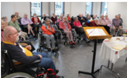
La célébration de la messe, un repère important.

Avec chacun des membres du personnel, nous avons partagé les tâches sans aide supplémentaire. Début mai a marqué la reprise des activités puis les repas en groupe. Gym douce, ateliers relaxation, sorties accompagnées sur la terrasse ou dans le parc ont procuré une bienfaisante détente. Dans