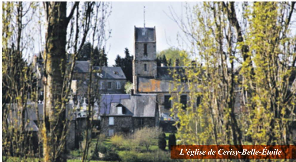
L'église de Cerisy-Belle-Étoile

Si le régime de propriété des édifices semble avoir été une sanction infligée par la République à l'Église catholique alors récalcitrante, privant celle-ci de la libre disposition des biens qui lui revenaient