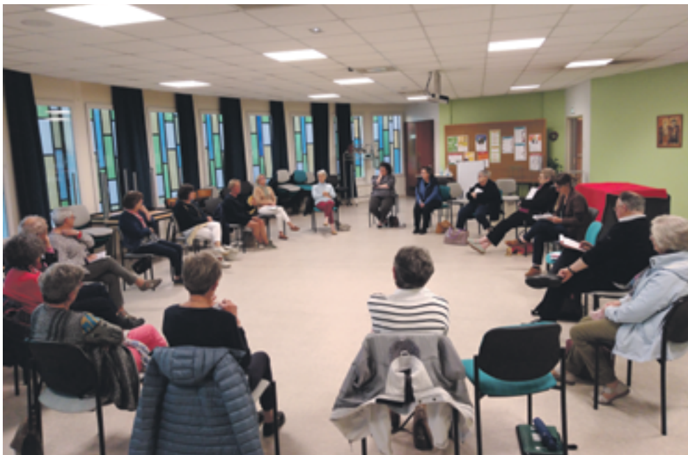
Une rencontre du réseau d'appelants à la maison paroissiale.