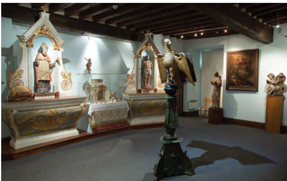
La salle dite de la contreréforme

La visite se déroule selon un parcours chronologique qui entraîne le visiteur du Moyen Âge au XX e siècle, lui permettant de découvrir, sur les murs et dans les vitrines, des tableaux représentant des scènes bibliques, des statues de saints dont certaines sont fort touchantes, des ornements liturgiques brodés, des pièces d'orfèvrerie et une multitude d'objets divers, représentatifs de la vie religieuse au fil des siècles.