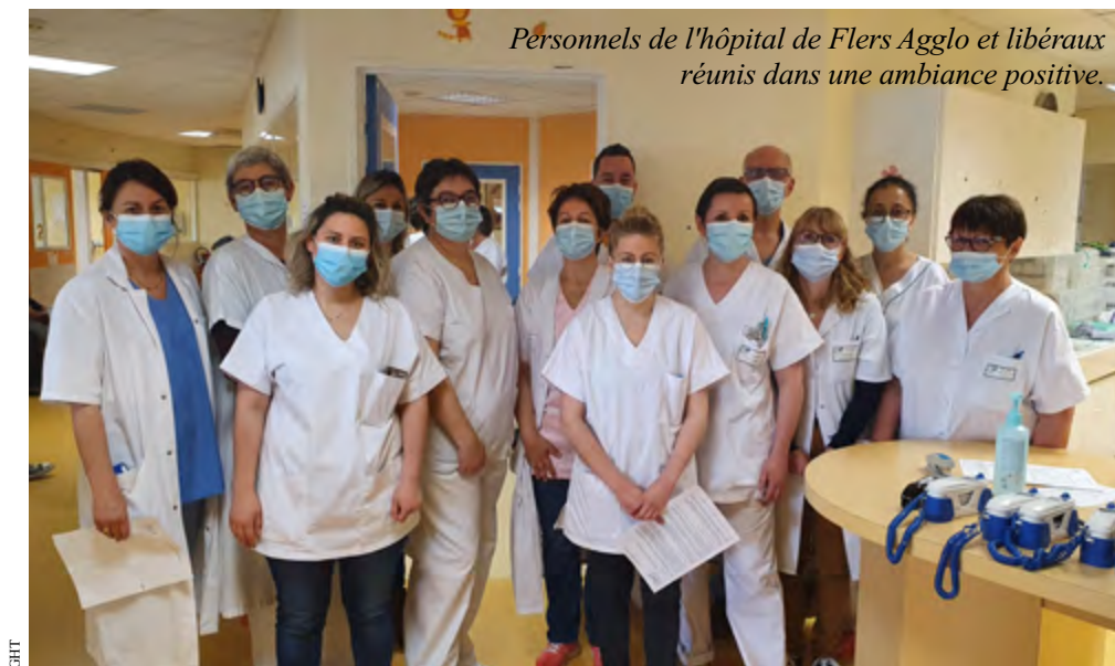
Personnels de l'hôpital de Flers Agglo et libéraux réunis dans une ambiance positive.

c'est une solution pour lutter contre le virus, alors il fallait le faire!”