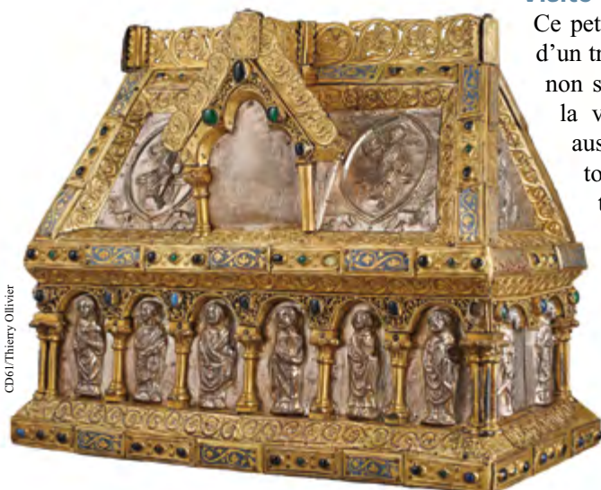
La châsse de saint Evroult.

À suivre dès maintenant sur http://musee-art-religieux.orne.fr/