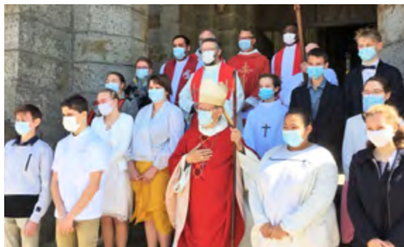
Les confirmés autour de Mgr Louis

Un nouveau groupe de jeunes se prépare à être confirmé dans quelques mois. Tout jeune intéressé peut encore les rejoindre (c'est maintenant). Les beaux témoignages recueillis à Athis sur les découvertes spirituelles comme sur l'ambiance de fraternité et d'amitié sont un encouragement pour tous ceux qui hésitent. De même, contrairement à une idée répandue, tout adulte, quel