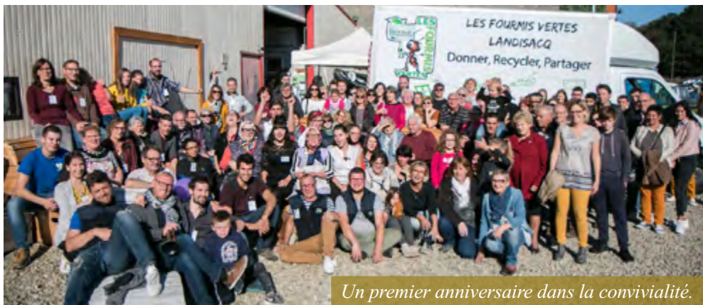
Un premier anniversaire dans la convivialité.