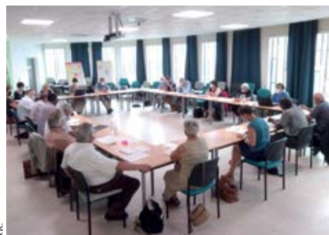
Lors de la rencontre des représentants des paroisses le 16 juin dernier.

Si vous souhaitez préparer une célébration d'obsèques (choix de textes et de chants en particulier), ou vous nourrir spirituellement, ou même sourire, vous trouverez matière en parcourant le site de la paroisse Marcel Callo, www.paroissemarcelcallo61.fr . Bonnes consultations.