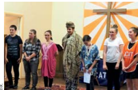
Les Artistes de la paix ovationnés à l'issue du spectacle.

expropriations au Mexique, procès de journaliste en Chine, violences génocidaires au Rwanda. À l'occasion de la "Nuit des veilleurs", le 26 juin au temple de Condé, avait lieu la première représentation des "Artistes de la paix" devant leurs familles, des membres des paroisses protestante et catholique et des militants de l'Acat. Tous ont apprécié la qualité de la prestation et mesuré le travail qu'elle a nécessité. Et ces jeunes n'entendent pas en rester là !