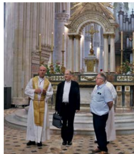
Découverte de la cathédrale.