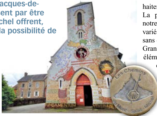
Des "clous" signalent les endroits remarquables sur chemin comme ici, à Ménéil-Gondouin.

Les routes menant autrefois en pèlerinage vers le Mont-Saint-Michel étaient diverses et convergeaient depuis l'Angleterre, l'Espagne, l'Italie ou l'Allemagne. Au Moyen Âge, elles furent très fréquentées, en particulier par des groupes d'enfants. Le chemin de Cologne (Allemagne) passe par Paris puis entre sur le territoire de notre pôle missionnaire au nord-est de Briouze pour en ressortir au sud de La Ferrière-aux-Etangs. En une bonne trentaine de kilomètres sont ainsi traversées les communes de Saint-André puis Saint-Hilaire-de-Briouze, Lignou, Pointel, Briouze, Bellou-en-Houlme, Saires-la-Verrerie et La Ferrière-aux-Etangs. Depuis maintenant plus de 30 ans, l'association "Les chemins du Mont-Saint-Michel" s'efforce de retrouver et de pro-