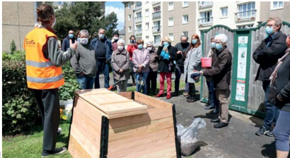
Un animateur du Sirtom présente le fonctionnement d'un composteur aux habitants du quartier Saint-Michel

Le Sirtom de la région Flers-Condé a mis à notre disposition quatre composteurs ; il