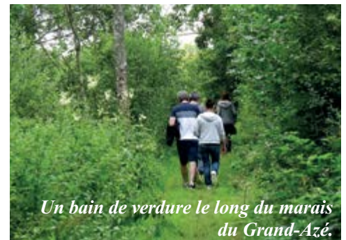
Un bain de verdure le long du marais du Grand-Azé.