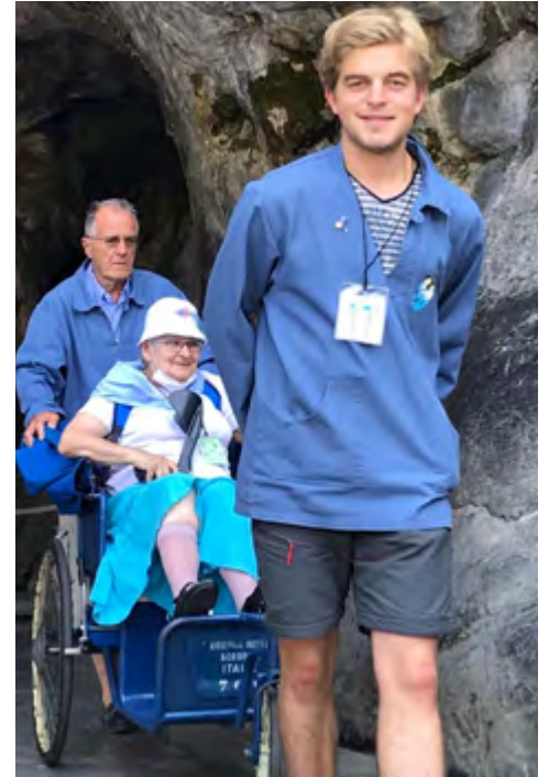
Roulage à la Grotte.

On est hospitalier à partir de 16 ans et on le reste tant que notre santé le permet. Toutes les compétences sont les bienvenues. Pour les services en chambre et le roulage, une formation est organisée dès le 1 er jour ; nous ne sommes jamais seuls, chacun apprend au contact des autres. Les