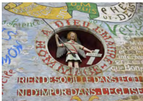
Un détail de la façade peinte.

Sur les dalles du sol est gravé l'arbre de Jessé : du seuil à l'entrée du chœur, nos pas glissent sur l'histoire de l'Église depuis les