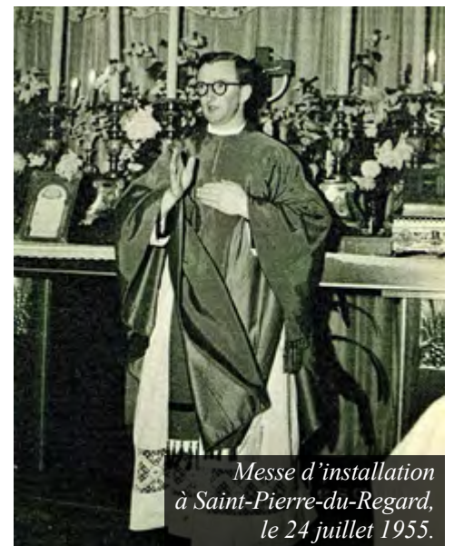
Messe d'installation à Saint-Pierre-du-Regard, le 24 juillet 1955.