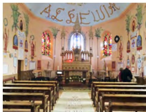
À l'intérieur, les murs sont peints et parsemés de palmiers.