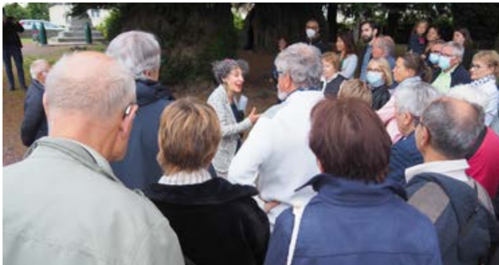
Accueil des visiteurs sous les ifs millénaires de La Lande-Patry.

La bannière des Trinitaires (1630): il s'agit d'une bannière de procession en soie, une des plus anciennes de Normandie. Il existait, à La Lande-Patry, une