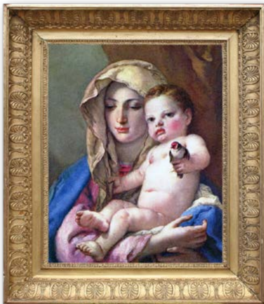
Giambattista Tiepolo (1697-1770), “Madone au chardonneret”, vers 1760

Devenue l'emblème universel de la paix en 1949, la colombe est depuis bien longtemps symbole d'espoir et d'harmonie. Par sa couleur blanc immaculé et la douceur qu'évoque son roucoulement, la colombe est devenue un symbole de pureté et de simplicité. Dans le Nouveau Testament, elle représente l'Esprit saint. Lors du baptême de Jésus, les quatre évangélistes (Matthieu,