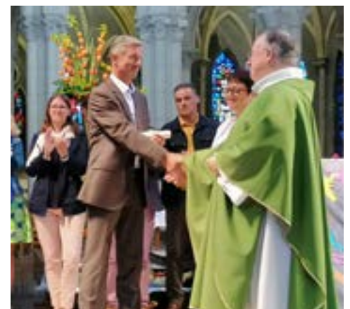
Remise de la lettre de mission par le vicaire général à Flers en septembre 2019.