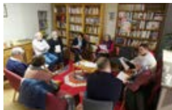
En Bocage comme en Perche-Ouche, plusieurs réunions préparatoires ont été nécessaires

Il y a plus d'un an, les responsables nationaux du Secours catholique invitaient les membres des équipes et territoires locaux à se mobiliser à l'occasion des élections législatives. Deux objectifs : permettre aux personnes accueillies, souvent ignorées, parfois rejetées, de participer à la vie citoyenne ; mais aussi faire connaître les propositions du Secours catholique.