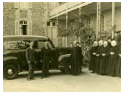
La remise d'une Chevrolet aux Petites sœurs des Pauvres en 1949.