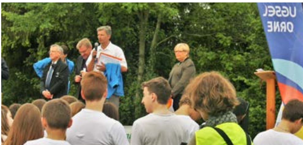
Lors d'un rassemblement de la fédération Ugsl.