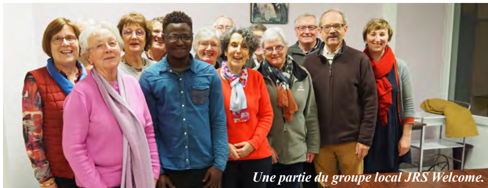
Une partie du groupe local JRS Welcome.

JRS est une ONG active dans 56 pays, dont la France sous forme d'association Loi 1901 dans une quarantaine de villes, dont Flers. Elle lutte contre l'isolement et l'exclusion sociale des demandeurs d'asile et des réfugiés. À Flers, JRS Welcome accueille des demandeurs d'asile afin qu'ils puissent trouver le temps de se structurer, de se sécuriser, de respirer pendant que l'Administration examine leur dossier. De nouveaux accueillants sont toujours les bienvenus.