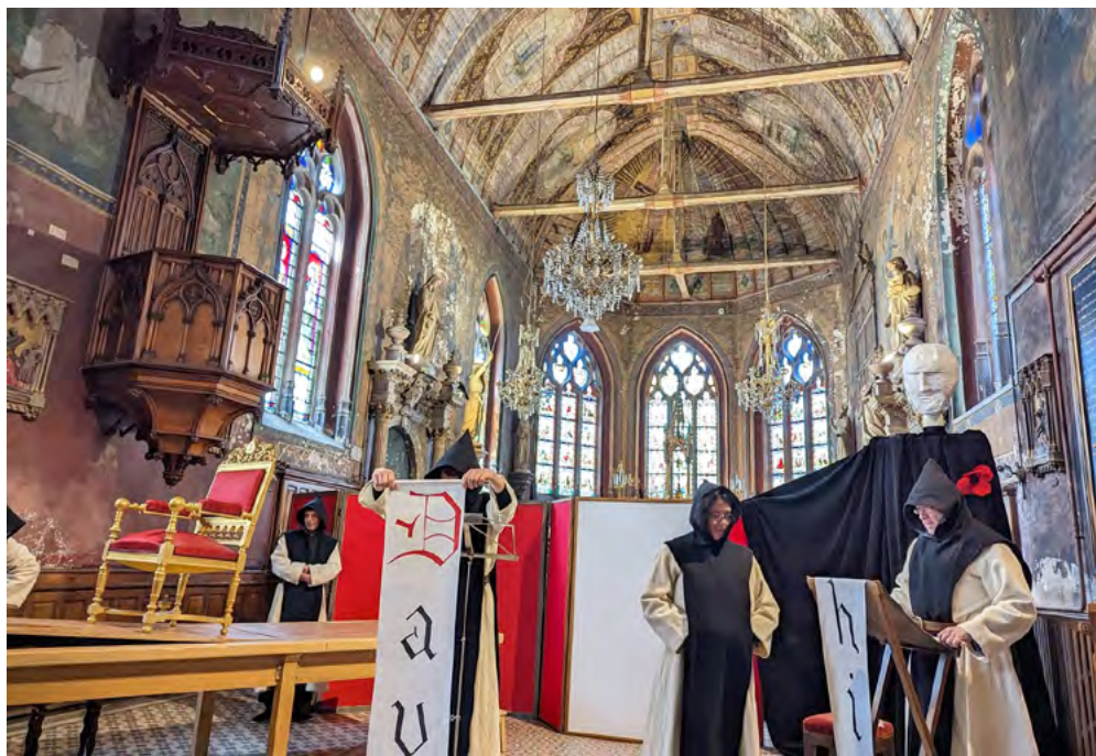
Une répétition avant la représentation de la pièce Une tapisserie pour Marguerite jouée à Mortagne en 2023.

Avec Jeunes Vivants, plus de 100 jeunes ont découvert la vie de troupe. Au cours de mes 20 années au sein de celle-ci, j'ai vu des jeunes s'épanouir, grandir, prendre des responsabilités, se découvrir des talents qu'ils ne soupçonnaient pas... Certains sont venus quelques mois ou quelques années, d'autres sont partis et revenus mais tous ont gardé un bon souvenir de leurs années dans la troupe.”