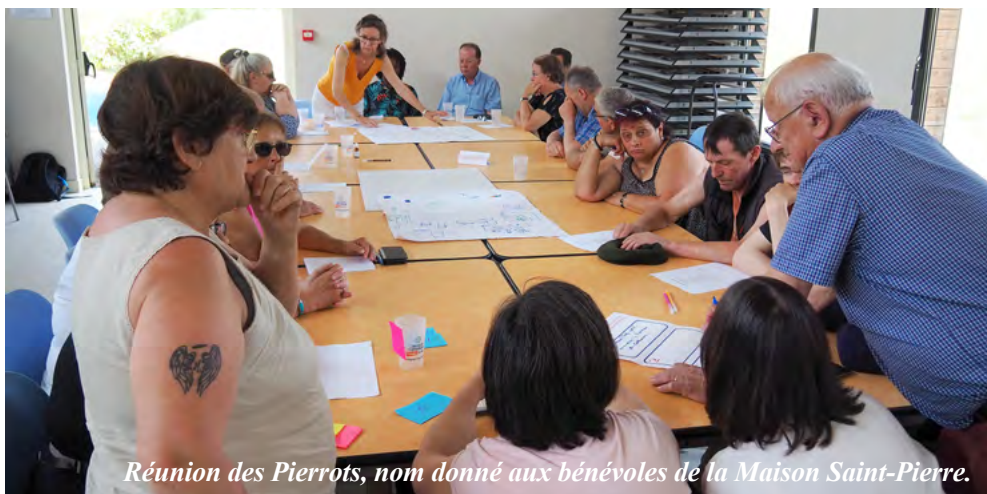
Réunion des Pierrots, nom donné aux bénévoles de la Maison Saint-Pierre.

Je me dis pourquoi une telle épreuve ? Nous avons perdu tous nos stocks. Le bâtiment est inexploitable pour de longs mois. Mais cessons de pleurer. Nous travaillons à adapter certaines activités et nous venons de décider de reconstituer nos stocks de meubles, électroménager, vaisselle et bibelots pour ouvrir en septembre 2024. Même les plus fragiles d'entre nous arrivent à nous étonner. Rien que pour ça, l'aventure du Secours catholique est pour moi un vrai bonheur.