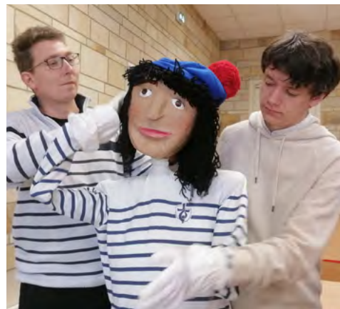
Séance de répétition avec des marionnettes.

suivre et maintenant j'interprète des rôles plus importants. En même temps, je suis devenue accessoiriste, fabriquant des objets et des marionnettes pour nos différentes pièces et même couturière pour la pièce Une tapisserie pour Marguerite . La musique et le chant ne font pas partie de mes talents mais de nombreux musiciens et chanteurs se sont exprimés au sein de la troupe et certains, même, se sont découvert une voix.