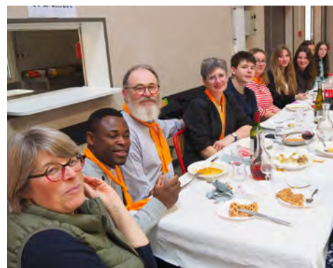
Une partie des serveurs, passés à leur tour à table pour un repas et un repos bien mérités.

Gérard Huet, avec le concours d'Aurélie Lefayvre