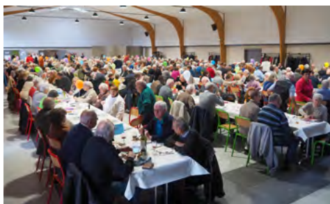
Plus de 500 convives réunis à Saint-Georges-des-Groseillers.