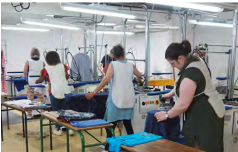
L'atelier de repassage de l'AIFR.

La baisse régulière du taux de chômeurs ces derniers temps permet à un nombre croissant de personnes d'accéder à un emploi. Mais on constate que des difficultés demeurent et que certains métiers attirent peu (éprouvants, mal rémunérés, peu valorisants...). Sur le chemin vers l'emploi, les obstacles sont encore nombreux : handicap, échec scolaire, divisions et ruptures familiales... Nous avons choisi de rencontrer des organismes qui facilitent l'accès à un travail stable et de découvrir des expériences réussies grâce à la volonté des intéressés et à l'accompagnement bienveillant de leur entourage.